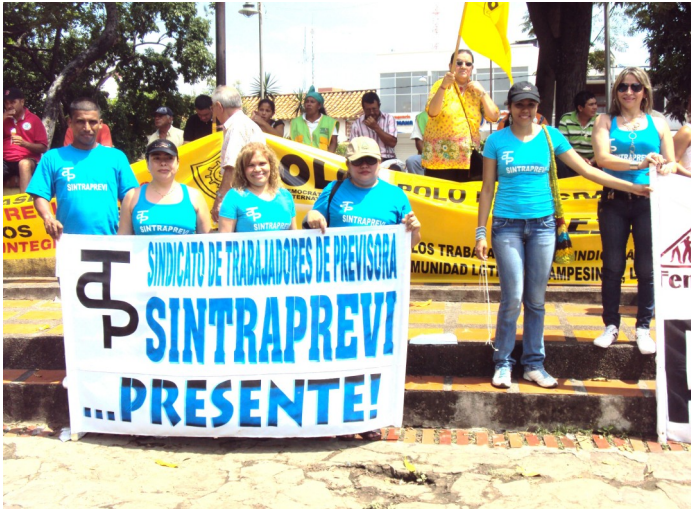
Nuestra organización PRESENTE, PRESENTE, PRESENTE