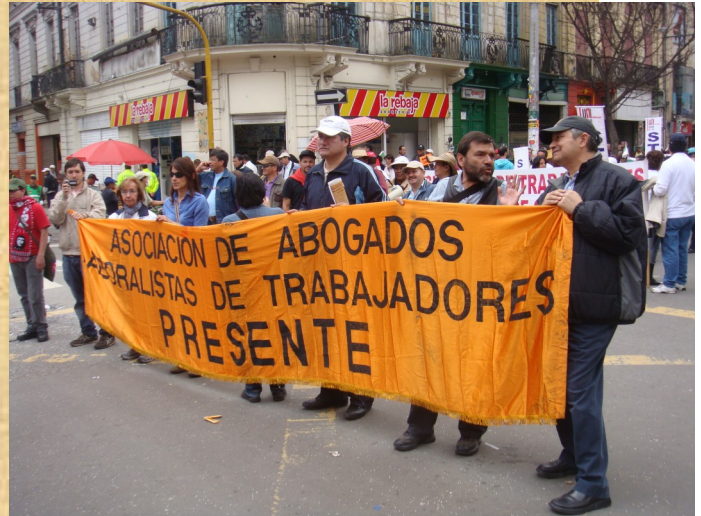
La solidaridad y fraternidad con otras organizaciones sociales se demuestra el 1o. de Mayo.