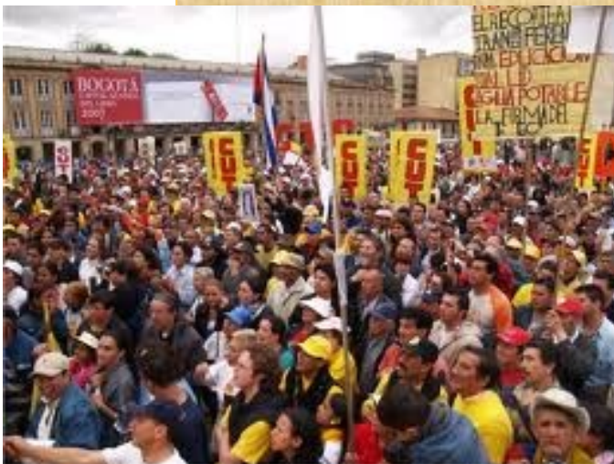
Colmada se vió la Plaza de Bolívar en Bogotá